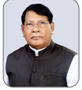
डॉ. रामेश्वर उराँव वित्त मंत्री