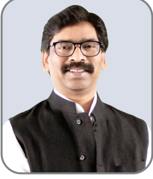
श्री हेमन्त सोरेन मुख्यमंत्री, झारखण्ड